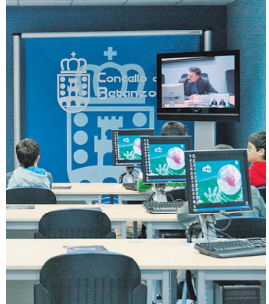
Las aulas de la Red CeMIT imparten formación digital

Un paseo a través de las distintas webs de los concellos de la comarca muestra una clara evolución y una lucha por la modernización, aunque evidencia también notorias carencias en la mayoría de los casos, sobre todo si se comparan con las de las empresas del sector privado: «Por desgracia la Administración suele ir un paso por detrás, su nivel de innovación no es muy elevado. Las em-